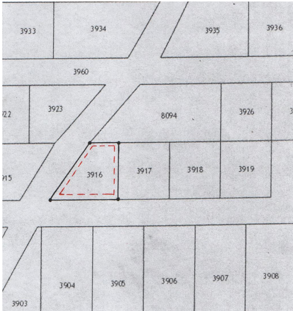
ЧЕРТЁЖ ГРАДОСТРОИТЕЛЬНОГО ПЛАНА земельного участка

Приложение к градостроительному плану земельного участка № 59:41:0010001:3916