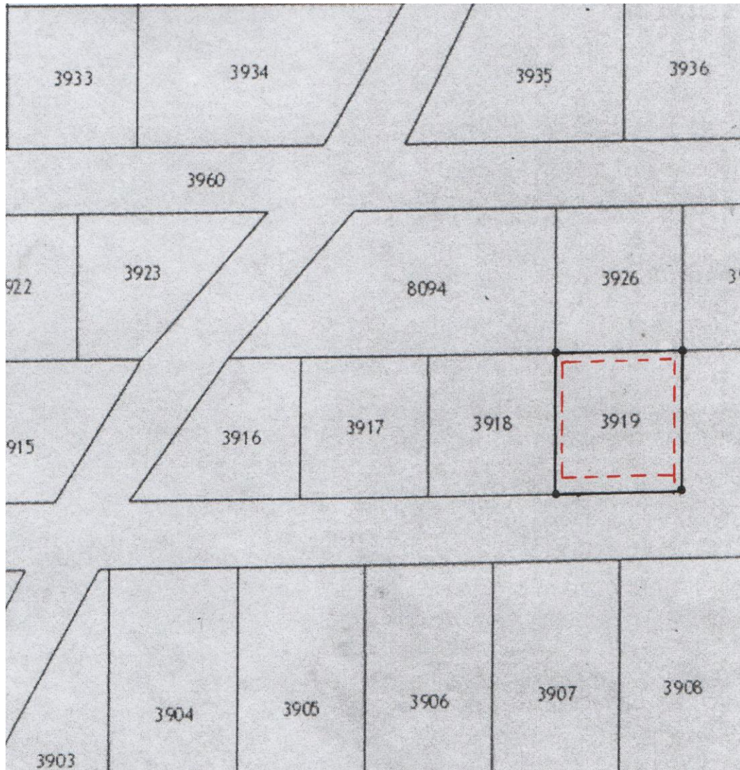
ЧЕРТЁЖ ГРАДОСТРОИТЕЛЬНОГО ПЛАНА земельного участка

Приложение к градостроительному плану земельного участка № 59:41:0010001:3919