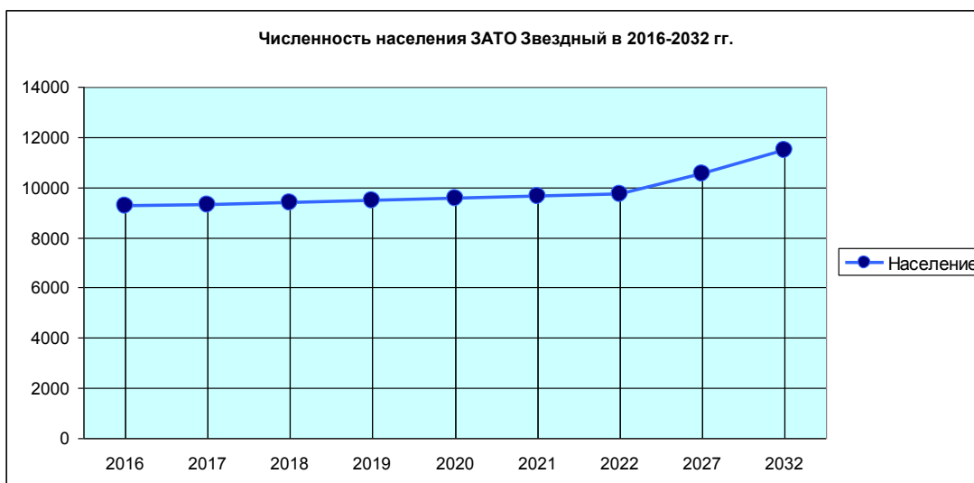
Рис. 1. Численность населения ЗАТО Звёздный в 2016-2032 гг.

Естественное повышение населения за 2017 г. составило 104 человека. В течение 2016 - 2018 годов наблюдается устойчивая тенденция превышения рождаемости над смертностью.