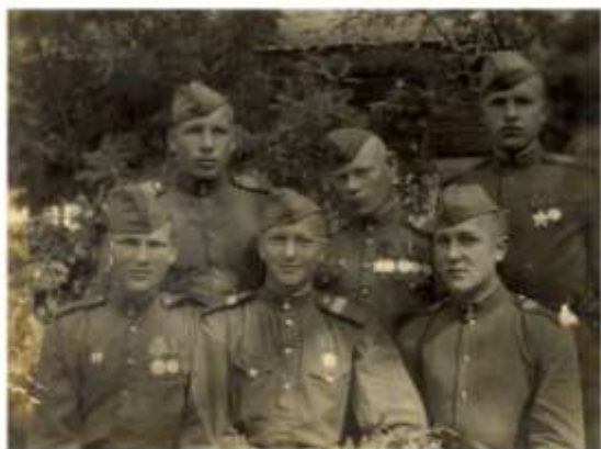
На фотографии крайний слева