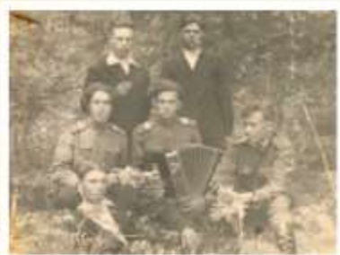
На фотографии во втором ряду слева