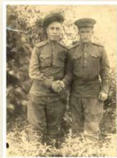
На фотографии слева