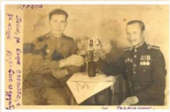
На фотографии крайний справа

Родился 23 февраля 1926 года. В 1942 г. в 16 лет добровольцем призвался в Уральский танковый корпус. Войну закончил в Берлине. После войны проживал в посёлке Кукуштан Пермской области. Умер 21 января 1969 года.