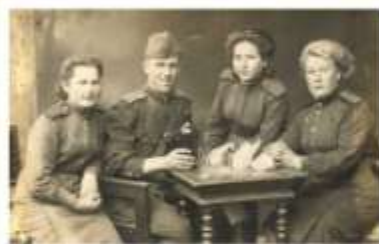
На фотографии третья слева

Как разглядеть за днями след нечеткий? Хочу приблизить к сердцу этот след.. На батарее были слюнь - девчонки. А старшей было восемнадцать лет. Лихая челка над прищуром хитрым, Бравурное презрение к войне.. В то утро танки выжили прямо к Химкам. Те самые. С крестами на броне.. И старшая, действительно старая, как от конимара, заслоняя рукой, скомандовала тонко: - Батарея-а-а! (Ой, мамочка!.. Ой, родная!..) Огонь!.. -И- злт!..