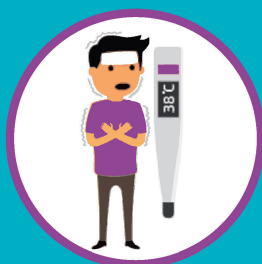
ПОВЫШЕННАЯ ТЕМПЕРАТУРА ТЕЛА