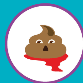
ПРИМЕСИ В КАЛЕ (СЛИЗЬ, КРОВЬ)