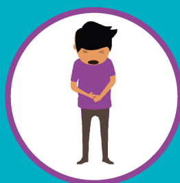
БОЛЬ В ЖИВОТЕ