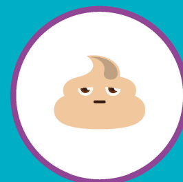
ИЗМЕНЕНИЕ ЦВЕТА КАЛА